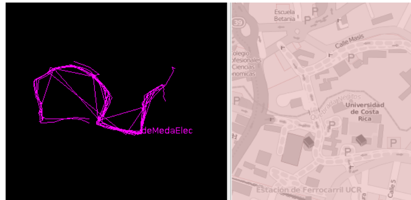
Figura 2: Representación de la ruta del bus universitario

Etapas III. Diseño y prueba del programa base Posterior a la recolección de datos se ingresó estos en una plataforma de software libre para mapear los datos encontrados, encontrando la Figura 1. la cual corresponde a la ruta del bus interno de la Universidad de Costa Rica. Ver Fig.2